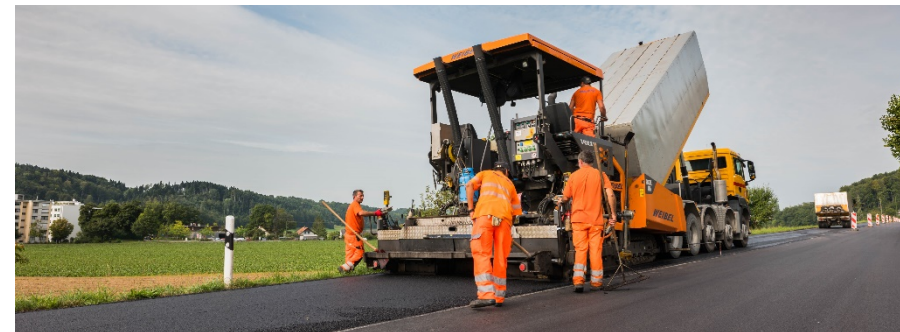
Belagseinbau Fahrtrichtung Bern