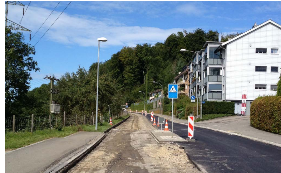
Fräsarbeiten Fahrtrichtung Bern